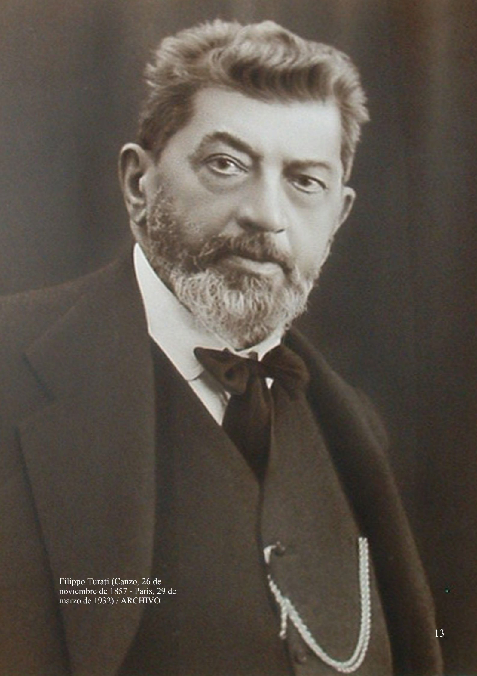
Filippo Turati (Canzo, 26 de noviembre de 1857 - París, 29 de marzo de 1932)