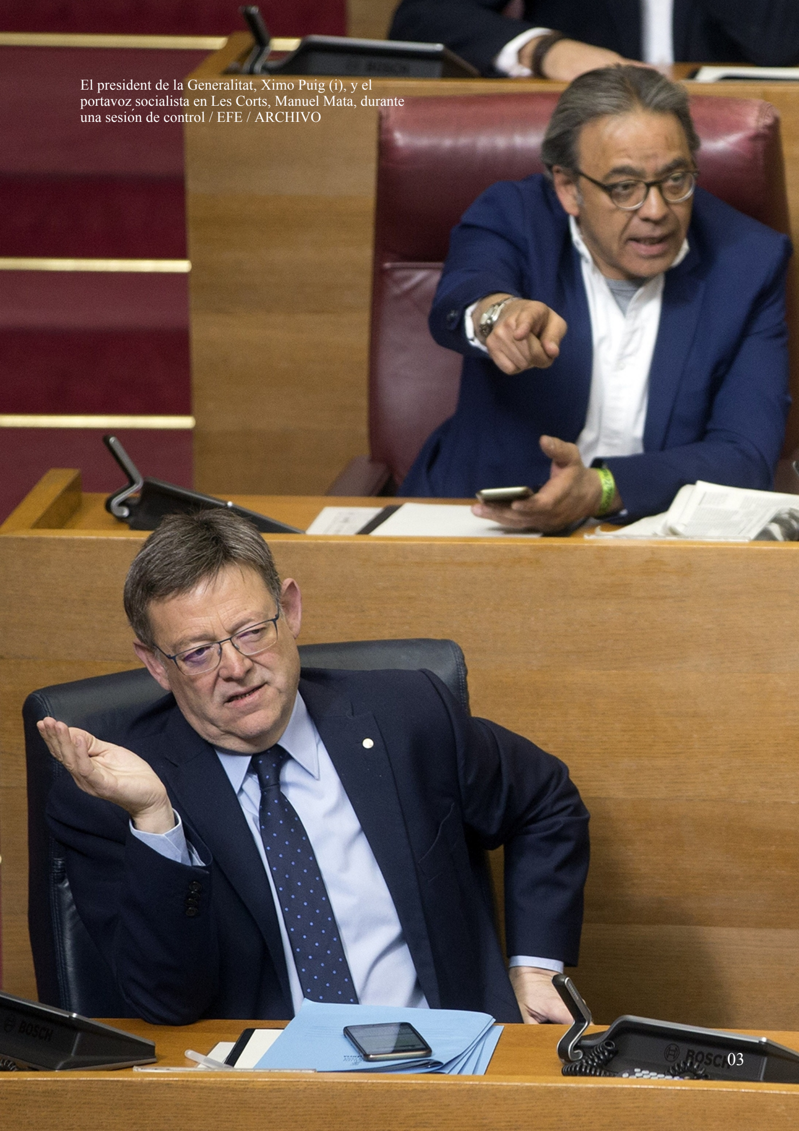
El president de la Generalitat, Ximo Puig (i), y el portavoz socialista en Les Corts, Manuel Mata, durante una sesión de control