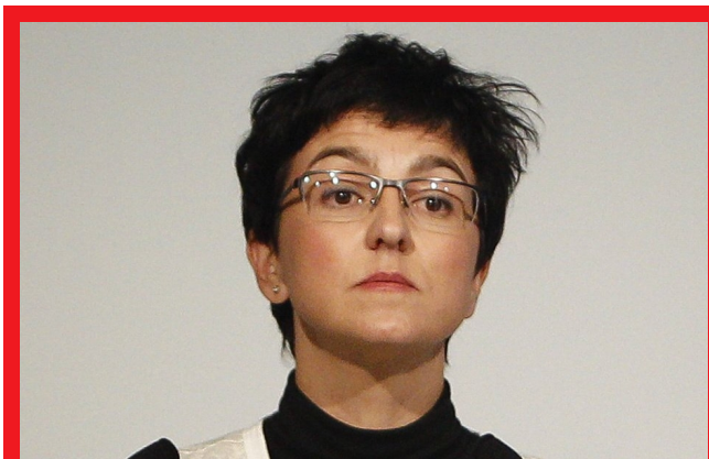
La portavoz del PSC en el Parlament, Eva Granados

La portavoz del PSC en el Parlament, Eva Granados, ha considerado que existen "discrepancias" y "tensiones" entre los socios del Govern, que están "más preocupados" en los resultados de unas posibles elecciones catalanas que en gobernar Cataluña, por lo que ya "no confían" los unos en los otros. En rueda de prensa en la cámara catalana, Granados ha valorado así la situación que se ha generado entre el PDeCAT y ERC, después